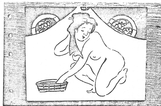
紀州和歌山一岐上明神(茅渟市・鏡磨古氏所蔵)

「入浴」の語源は、古語で「入る」と「浴(湯)」の意を合したものである。入浴は、古くから日本人の生活に欠かせない習慣であり、健康増進や精神的な安らぎをもたらす重要な行為とされている。